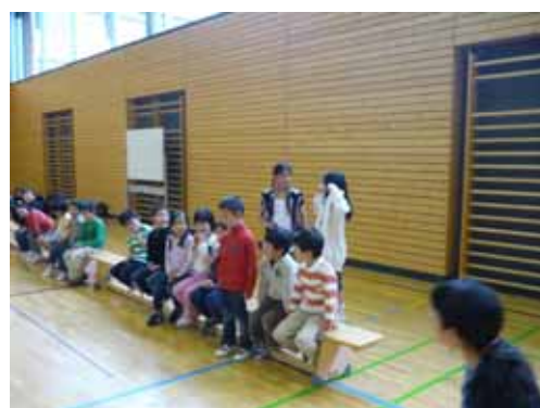
立派に自己紹介できました

体育館で楽しんだ後は縦割り班ごとに各教室へわかれ、本年度初めてのふれあいランチを行いました。1年生を教室まで迎えに行く6年生を見ながら、すっかり頼もしく成長した姿に感心させられました。